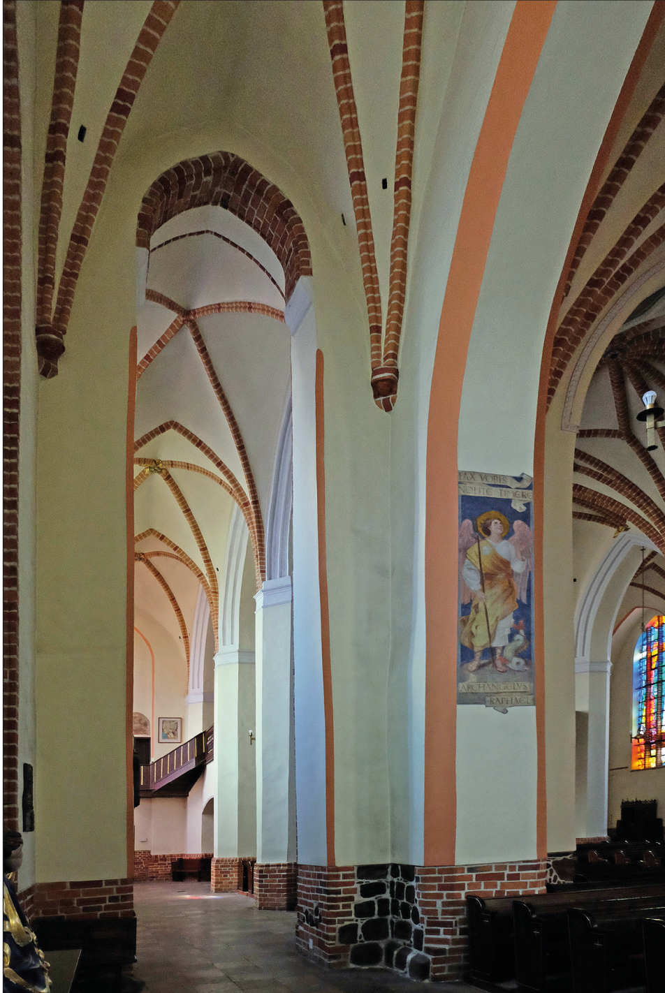
Ryc. 22. Stargard, kościół św. Jana, widok z obejścia chóru na południową nawę korpusu.