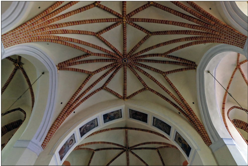
Ryc. 7. Stargard, kościół św. Jana, wschodnie przeszło sklepienne korpusu wraz z barokową arkadą tęczową; w tle sklepienie chóru.

wych lasek. Są to rozwiązania formalne faktycznie charakterystyczne dla XV w. Jednak w ciągu burzliwych losów kościoła św. Jana w późniejszych wiekach w budynku wprowadzono liczne zmiany stanowiące daleko idącą ingerencję w historyczną substancję budowlaną. W lipcu 1697 r. zawaliła się wieża kościelna i runęła na korpus nawowy 16 . Spadająca konstrukcja dachowa zniszczyła przekrycia wszystkich trzech naw, przyziemia wieży oraz kaplic wieżowych 17 . Sklepienia zrekonstruowano w 1699 r., wątpliwie jest jednak, czy odtworzono je w pierwotnej postaci 18 . Forma podłuczy arkad i łuku tęczowego oraz wykonane w tynku strefy kapitelowe filarów ukazują estetykę końca XVII w. (ryc. 7, 9). Zamiast ośmioramiennego sklepienia gwiaździstego, wykonanego w nawie głównej, korpus mógł pierwotnie posiadać prostsze sklepienie gwiaździste lub krzyżowo-żebrowe, podobnie jak w nawach bocznych lub też w korpusie pobliskiego kościoła Mariackiego, zanim został on przekształcony w formę bazylikową. Być może dawną formę sklepienia nawy głównej korpusu kościoła św. Jana podczas odbudowy w końcu XVII w. zastąpiono sklepieniem gwiaździstym, aby nawiązać do sklepienia gwiaździstego w chórze. Przypuszczenie to również potwierdza porównanie sklepień