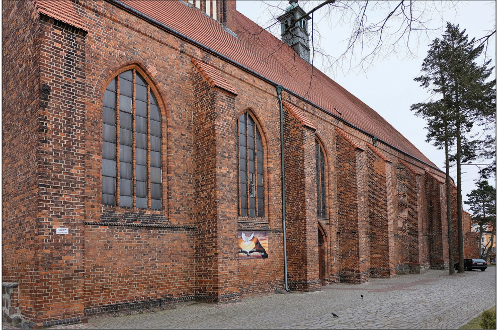
Ryc. 8. Stargard, kościół św. Jana, południowa elewacja korpusu nawowego od południowego zachodu.