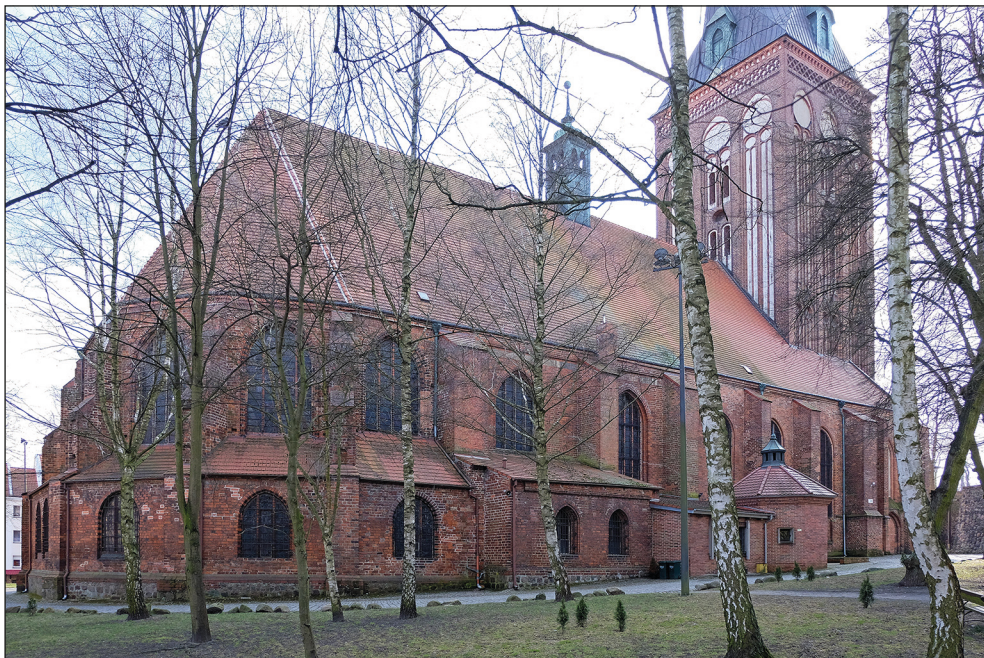
Ryc. 2. Stargard, kościół św. Jana, widok od północnego wschodu.

przekazał joannitom teren na wzgórzu, zwanym później Johannisberg , po południowo-zachodniej stronie grodu nad Iną 1 . Źródła pisane nie dają informacji, kiedy zakonnicy faktycznie osiedlili się w Stargardzie; pierwsze imienne wzmianki joannitów stargardzkich pojawiają się dopiero w dwóch dokumentach z 1234 r. 2 Brak również przesłanek źródłowych dotyczących czasu powstania kaplicy wzniesionej obok domu konwentualnego. W starszej literaturze przedmiotu przyjmowano, że budowę pierwszej kaplicy klasztornej zrealizowano jeszcze przed końcem XII w. 3 Odkąd jednak podczas prac remontowych we wnętrzu kościoła w 1980 r. w dolnej partii filarów chórowych odkryto starannie obrobione kwadry granitowe (ryc. 3–4), pochodzące zapewne z murów dawnej kaplicy joannickiej, w nowszej literaturze datowanie jej przesunięto na połowę XIII 4