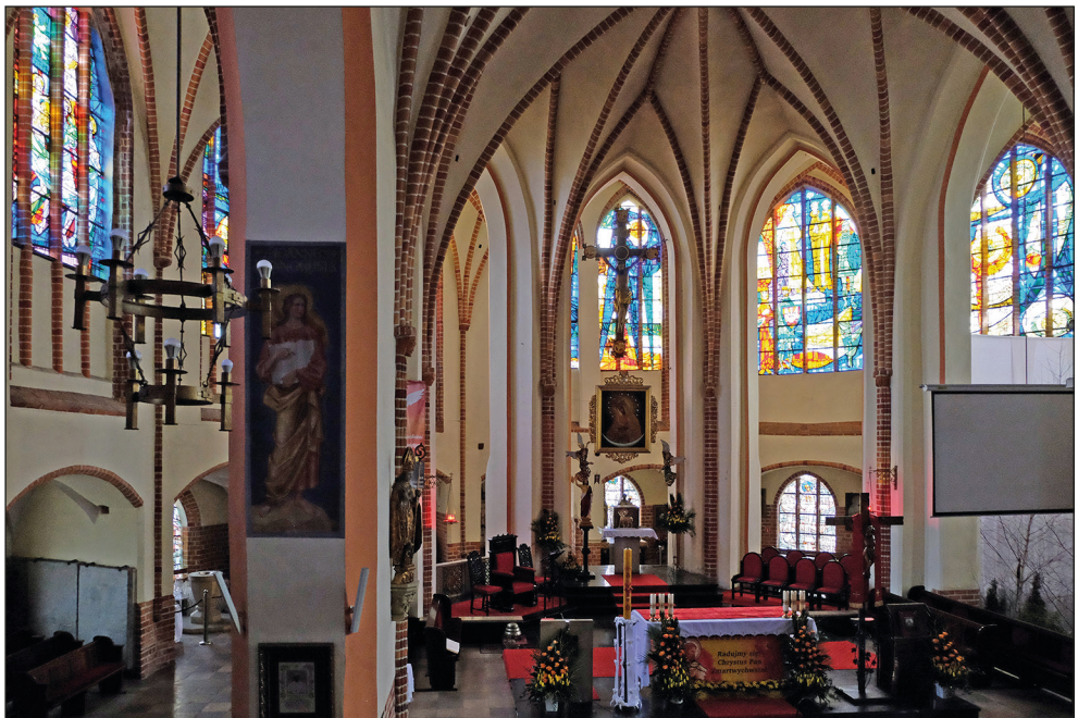
Ryc. 21. Stargard, kościół św. Jana, widok chóru w kierunku wschodnim.

dzystymi (w ambicie w połączeniu z trójdzielnymi). Dowodem na to są terakotowe wsporniki z maskami ludzkimi u nasady żeber sklepiennych wprowadzone w całej strefie chóru – zarówno w nawie głównej, jak i w obejściu (ryc. 21). Wykazują one pewne podobieństwo do wsporników z maskami terakotowymi w kaplicach pobliskiego kościoła Mariackiego, dobudowanych do północnej nawy bocznej korpusu w ciągu XV w. Nie można tu jednak formułować zbyt daleko idących wniosków opartych na analizie formalnej, gdyż maski terakotowe w kościele Mariackim stanowią w dużej mierze repliki średniowiecznych oryginałów z okresu restauracji fary na początku XX w. 50 Także i ten aspekt mógłby jednak świadczyć o tym, że przebudowę chóru kościoła św. Jana przeprowadzono wcześniej aniżeli dotychczas zakładano. Być może pod wrażeniem zakończonej niedawno budowy nowego chóru pobliskiego kościoła Mariackiego przebudowę partii wschodniej podjęto tu już w pierwszej połowie XV w., jeszcze przed ukończeniem wieży? Wpływ kościoła Mariackiego łatwo dostrzec nie tylko w dekoracji blendowej wieży świętojańskiej, lecz również w formie dekoracji masywnych skarp przy obejściu halowym kościoła św. Jana: do dziś czytelne są na nich pozostałości de-