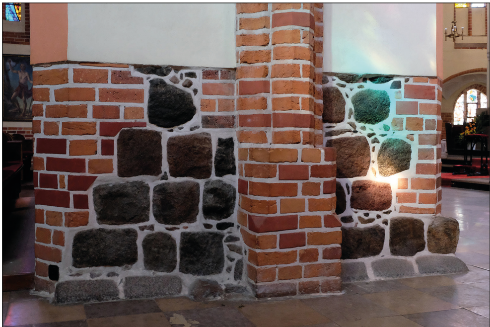
Ryc. 4. Stargard, kościół św. Jana, kwadry granitowe w dolnej partii filarów chórowych.