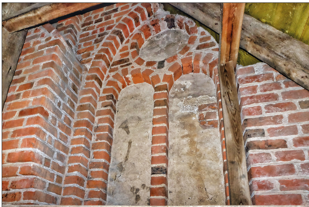
Ryc. 10. Stargard, kościół św. Jana, dekoracja blendowa wschodniego szczytu korpusu nawowego.

nymi łukiem pełnym i zwieńczonymi okulusem. Zarówno okulusy, jak i lancety pierwotnie wyprawione były tynkiem i zdobione malarstwem maswerkowym oraz rysunkami rytymi w tynku, których ślady zachowały się do dziś. Czoła lizen rozczłonkowane są wąskimi blendami tynkowymi bez podziałów wewnętrznych tworząc wraz z blendami kolorystyczny kontrast w stosunku do pozostałej płaszczyzny muru. U stóp szczytu przebiega fryz maswerkowy z alternującymi motywami czwórliścia (ryc. 11). Całościowa kompozycja szczytu o trójkątnym polu rozczłonkowanym pięcioma lizenami, z lizeną na osi środkowej oraz powtarzającym się rytmem dwóch blend lancetowych pomiędzy lizenami nawiązuje do typu wykształconego w szczycie wschodnim kościoła Mariackiego w Greifswaldzie (1328) 23 , a podjętym m.in. w szczycie wschodnim kościoła franciszkanów w pobliskim Szczecinie (1369) 24 . Szczyt greifswaldzki posiada wprawdzie znacznie bardziej rozbudowaną dekorację blend oraz kilkustrefową artykulację czołowych ścian lizen, jednak zarówno pod względem rozmieszczenia lizen na polu szczytu, jak i wprowadzenia stosunkowo rzadko występującego motywu dwóch wysokich blend bez podziałów poziomych pomiędzy lizenami, szczyty wschodnie w Greifswaldzie, Szczecinie i Stargardzie wykazują znaczne podobieństwo. Także szczyt zachodni kościoła klasztornego premonstratensów w Gramzow (datowany na lata po 1340) wykazywał niegdyś podobną kompozycję, na którą składały się pary wysokich, biegnących