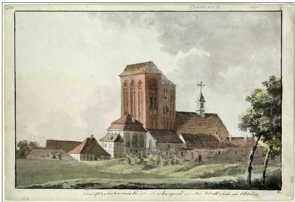
Ryc. 17. Stargard, Widok kościoła św. Jana i Bramy Świętojańskiej, ołówek / akwarela na papierze czerpanym, w zbiorach Pommersches Landesmuseum Greifswald, sygn. II St 28ks