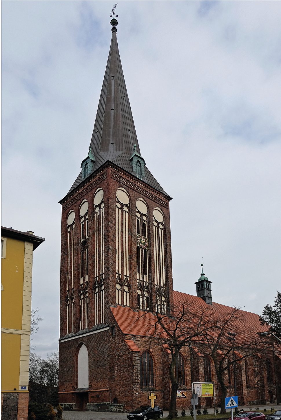
Ryc. 1. Stargard, kościół św. Jana, widok od południowego zachodu.