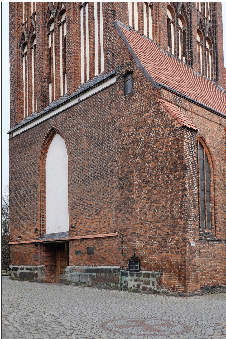
Ryc. 16. Stargard, kościół św. Jana, dolna kondygnacja fasady zachodniej wieży i południowy aneks wieżowy.