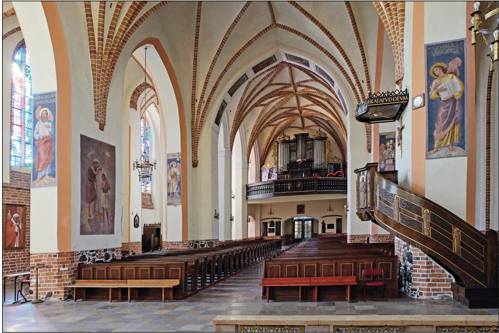
Ryc. 3. Stargard, kościół św. Jana, widok z chóru na korpus.