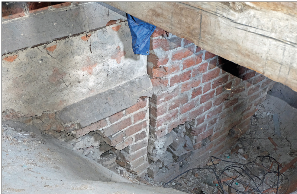
Ryc. 19. Stargard, kościół św. Jana, pozostałości dawnych murów obwodowych jednonawowego chóru nad sklepieniami obejścia, wyraźny szew w miejscu styku muru środkowego przęsła chóru z poligonalnym zamknięciem chóru (zdobionym fryzem tynkowym).