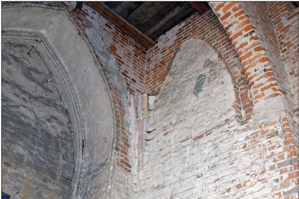
Ryc. 18. Stargard, kościół św. Jana, pozostałości polichromowanych żeber sklepiennych i malarstwa ściennego w hali podwieżowej, widok od południowego wschodu.

W przyziemiu wieży obecnie mieści się niska, przesklepiona kruchta. Jednak szwy widoczne na wschodniej ścianie znajdującej się nad nią hali podwieżowej dowodzą, że mieszcząca się w przyziemiu wieży przestrzeń pierwotnie nie była podzielona na dwie kondygnacje, tylko stanowiła obszerną halę otwierającą się wysoką arkadą na korpus nawowy. Zachowane nasady żeber sklepiennych oraz opory sklepienne ukazują, że hala ta była sklepiena i odpowiadała wysokością nawom korpusu. Wnętrze to posiadało pierwotnie bogatą kolorystykę, której pozostałości zachowały się na nasadach żeber sklepiennych; ściany, a prawdopodobnie również i sklepienie hali podwieżowej zdobiły malowidła figuralne, których ślady widoczne są jeszcze na ścianach (ryc. 18). Pierwotnie wnętrze przestrzeni podwieżowej oświetlone było przez wysokie okno ostrołukowe w fasadzie zachodniej, które – wtórnie zamurowane – obecnie czytelne jest w widoku wewnętrznym w postaci wysmukłej blendy tynkowej (ryc. 16). Budowę wieży ukończono zapewne około 1464 r., gdyż z tego roku pochodzi najstarszy dzwon kościoła św. Jana 43 .