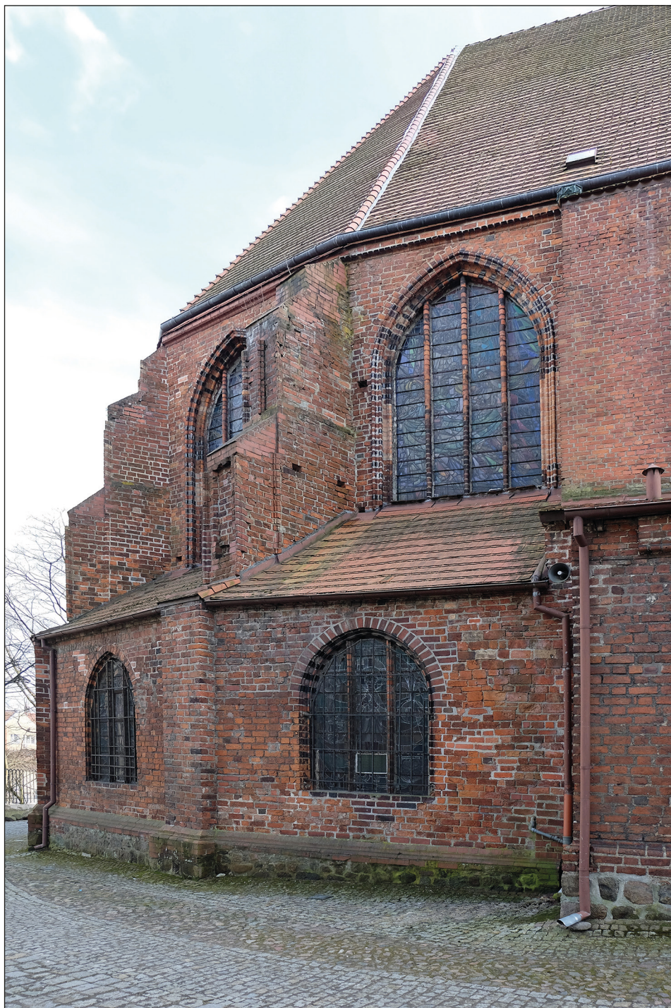
Ryc. 24. Stargard, kościół św. Jana, obejście chóru z niskim wieńcem kaplic, widok od północy.