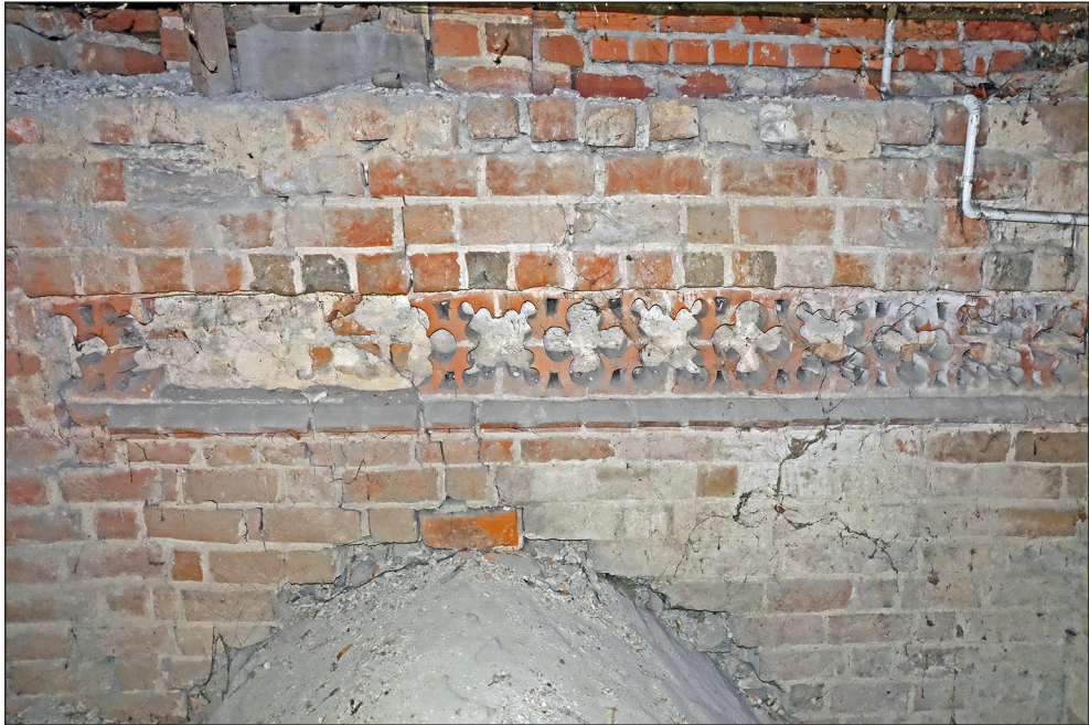
Ryc. 11. Stargard, kościół św. Jana, fryz maswerkowy u stóp wschodniego szczytu korpusu nawowego.

nieprzerwanie na całej wysokości szczytu blend lancetowych pomiędzy prostokątnymi lizenami 25 . Znaczne podobieństwo ze szczytem wschodnim stargardzkiego kościoła św. Jana, pomimo braku motywu zdwojonych blend pomiędzy lizenami, wykazuje również szereg szczytów meklemburskich kościołów wiejskich z drugiej połowy XIV w.: wspólne są im trójkątne pola szczytu dzielone prostokątnymi lizenami, rytmiczne zestawienie wydłużonej blendy z lizeną, podziały blend złożone z dwóch lancet zwieńczonych okulusem, osiowe ustawienie lizeny środkowej oraz rozczłonkowanie czoła lizen wąskimi wgłębными pasami tynkowymi bez podziałów wewnętrznych. Schemat kompozycyjny szczytu wschodniego kościoła św. Jana w Stargardzie był zatem jednym z typów częścię stosowanych w drugiej połowie XIV w.