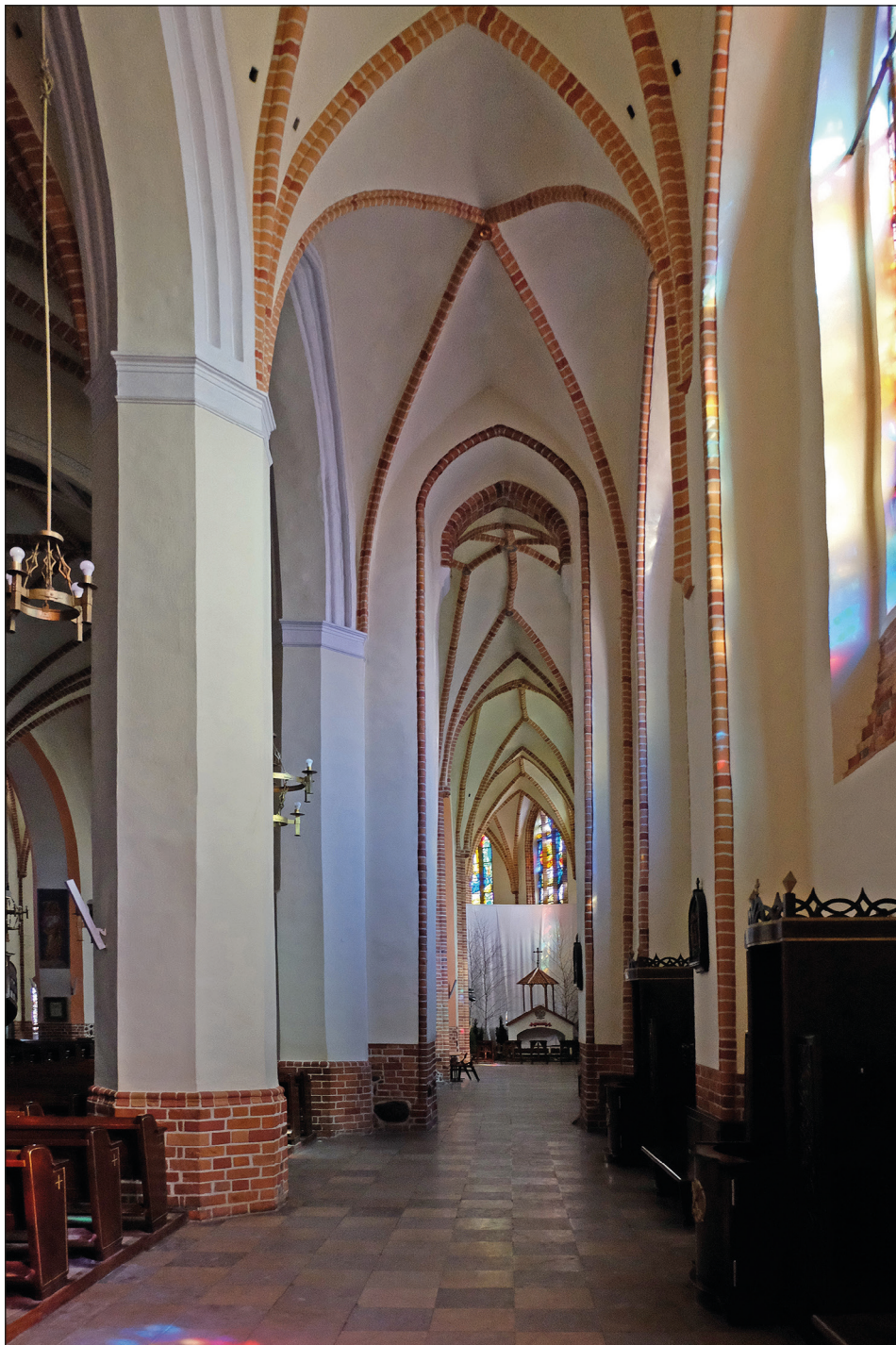
Ryc. 14. Stargard, kościół św. Jana, widok z południowej nawy korpusu w kierunku obejścia chóru.