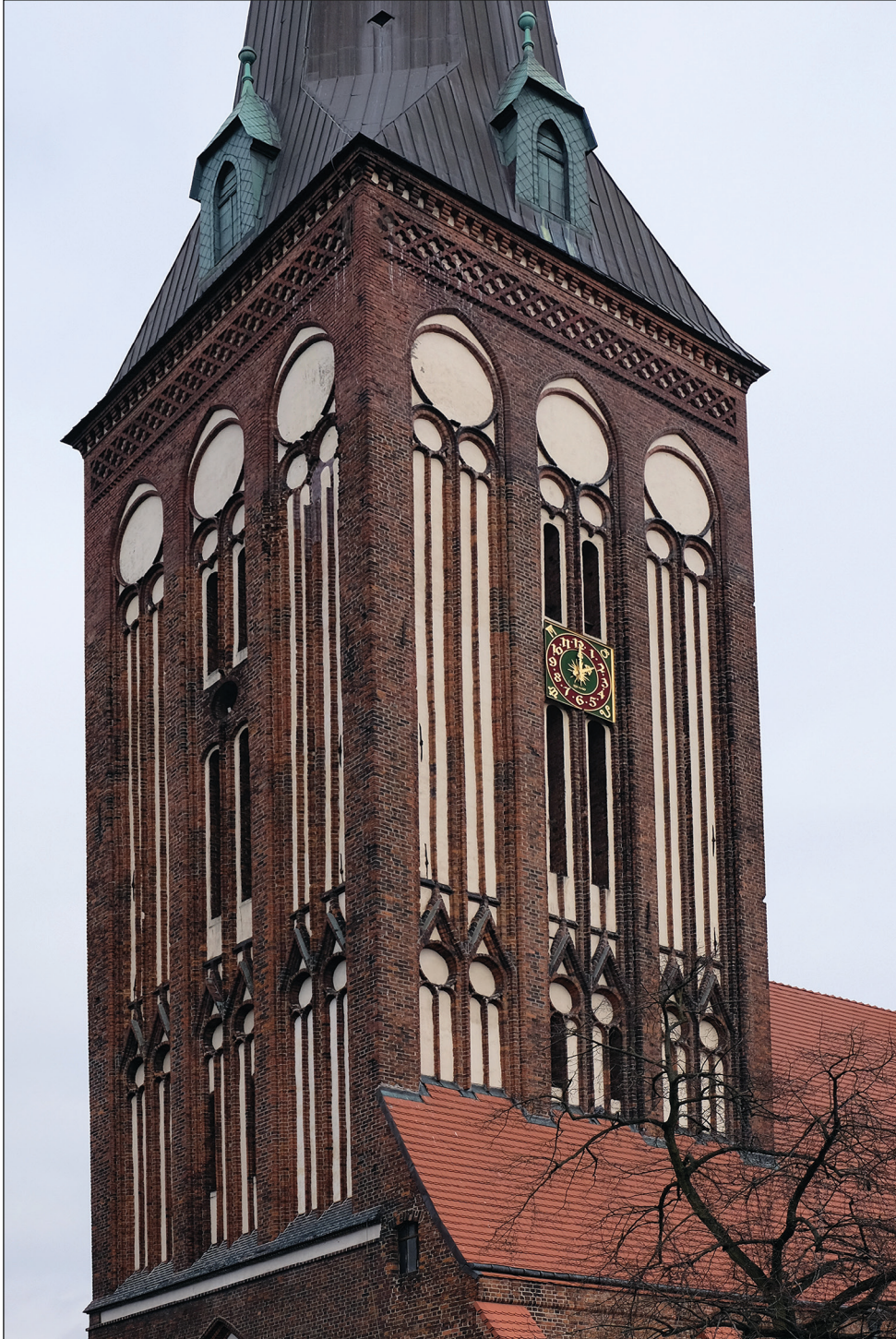
Ryc. 13. Stargard, kościół św. Jana, dekoracja blendowa wieży.