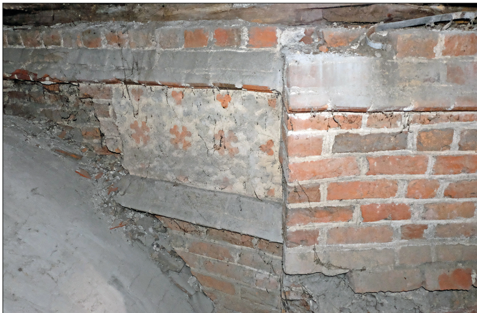
Ryc. 20. Stargard, kościół św. Jana, górna partia dawnego muru obwodowego poligonalnego zamknięcia chóru z widoczną po prawej stronie skarpą.