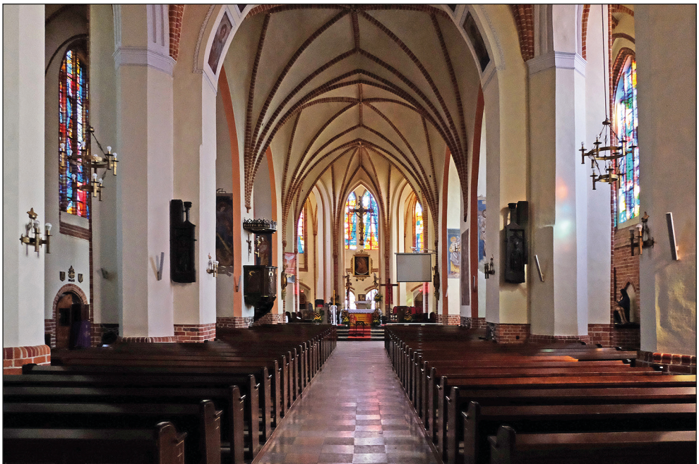
Ryc. 9. Stargard, kościół św. Jana, widok z korpusu na chór.