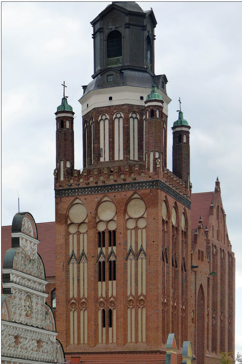
Ryc. 12. Stargard, kościół Mariacki, dekoracja blendowa wieży północnej.