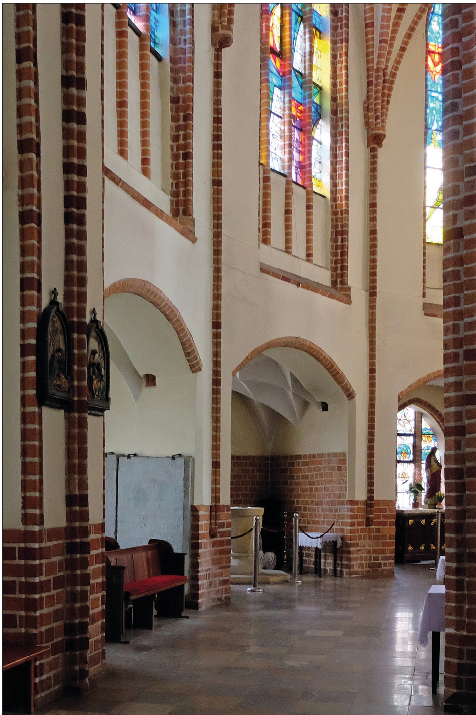
Ryc. 23. Stargard, kościół św. Jana, północna część obejścia chóru.