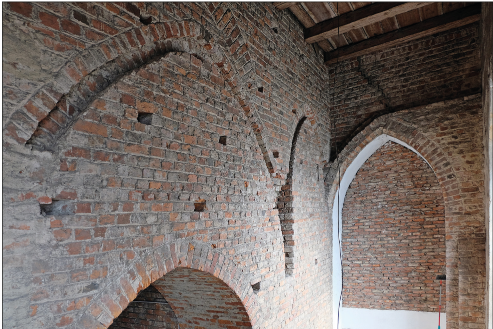
Ryc. 15. Stargard, kościół św. Jana, opory sklepienne na południowej elewacji rdzenia wieży w obrębie południowego aneksu wieżowego.

Równie ważnym argumentem jest fakt, że widoczne we wnętrzu obu hal przywieżowych w górnych partiach opory sklepienne na ścianach wieży (ryc. 15), przez niektórych badaczy uznawane za dowód na to, że dobudówki te wzniesiono wraz z rdze-